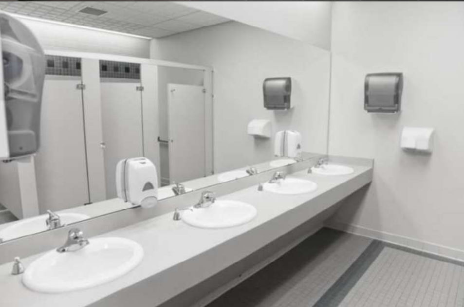
SPOSÓB MONTAŻU UMYWALEK I LUSTER