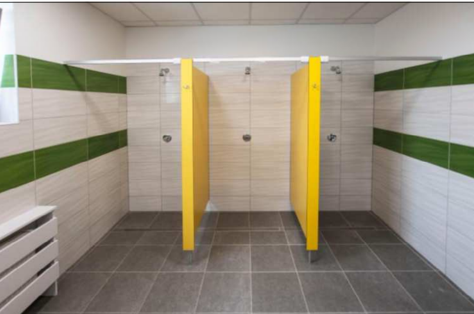
KABINY ZE ŚCIANKAMI HPL