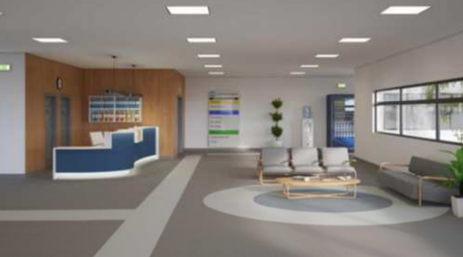
WYKŁADZINA PVC WYWINIĘTA NA ŚCIANĘ